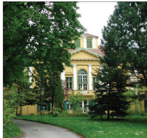
Sanatoriul Oberdöbling, 1883 - Viena